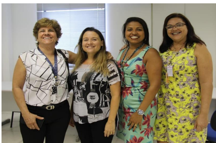
Fundação Oswaldo Cruz em Recife - Instituto Aggeu Magalhães - IAM