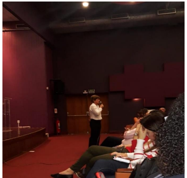
Coordenação Geral de Administração – COGEAD