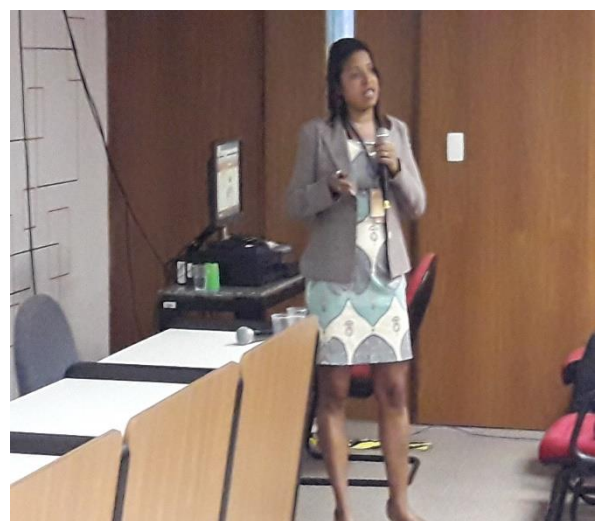
Instituto de Tecnologia em Fármacos – FARMANGUINHOS