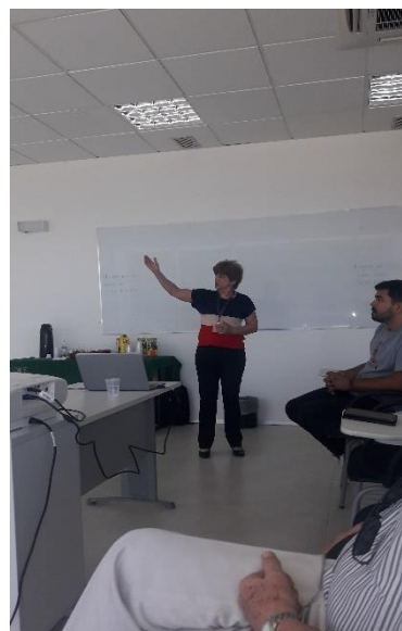
Fundação Oswaldo Cruz no Ceará – FIOCE