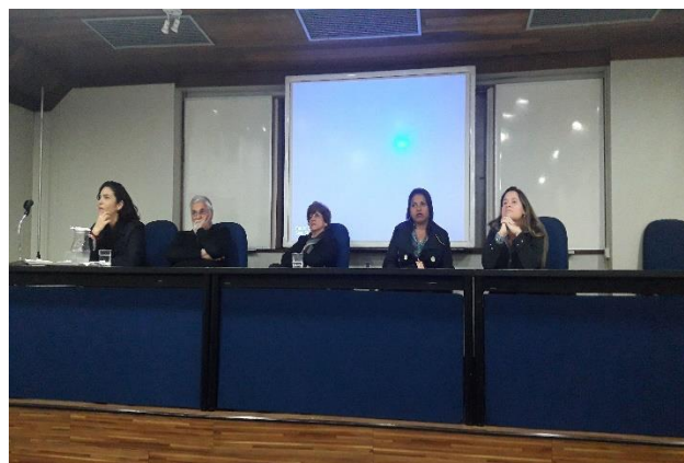
Instituto Nacional de Saúde da Mulher, da Criança e do Adolescente Fernandes Figueira-IFF