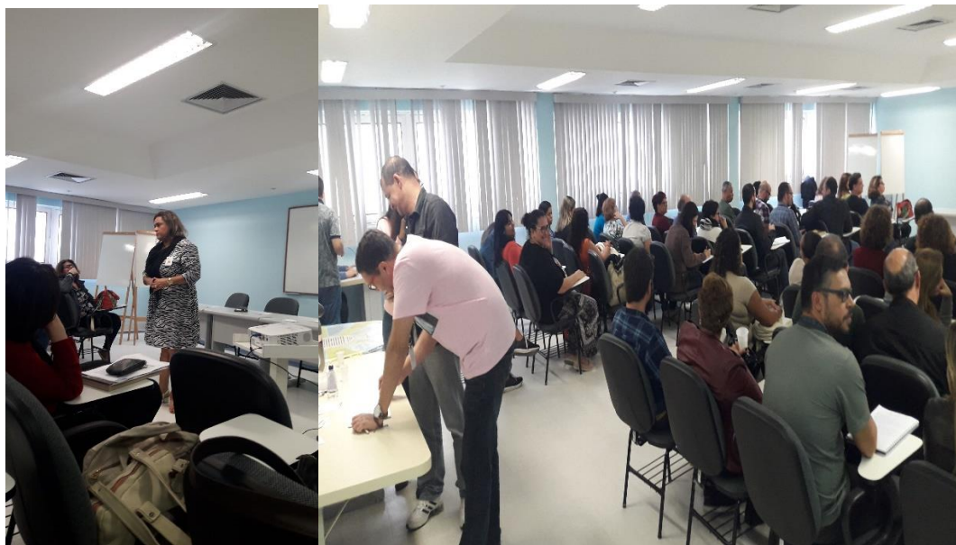
Coordenação Geral de Gestão de Pessoas - COGEPE