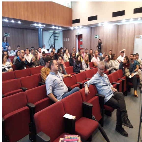
Instituto de Tecnologia em Imunobiológicos em Saúde - BIOMANGUINHOS