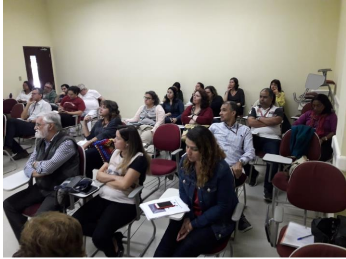
Escola Politécnica de Saúde Joaquim Venâncio