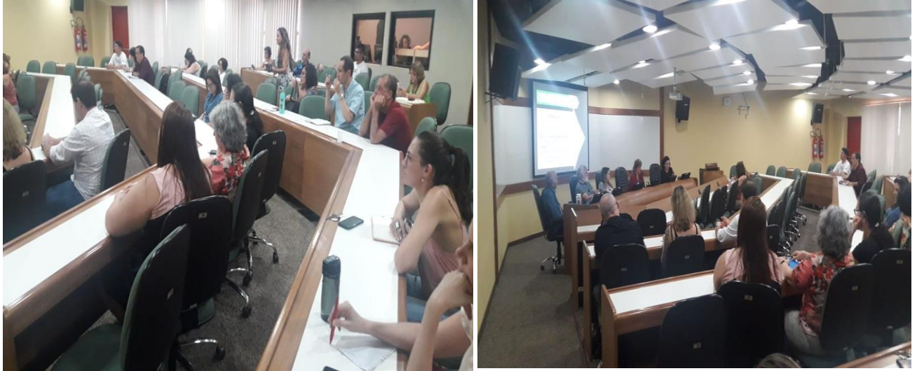
Escola Nacional de Saúde Pública Sérgio Arouca - ENSP