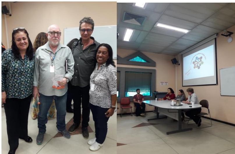
Instituto de Comunicação, Informação Científica e Tecnológica em Saúde - ICICT