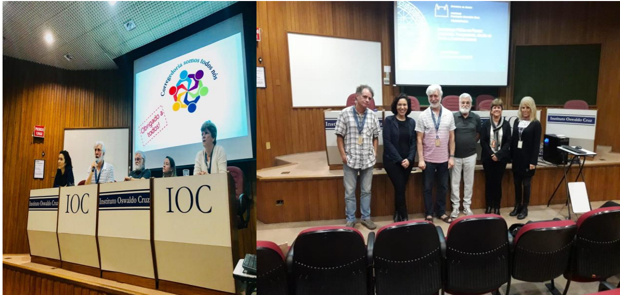
Instituto Oswaldo Cruz – IOC