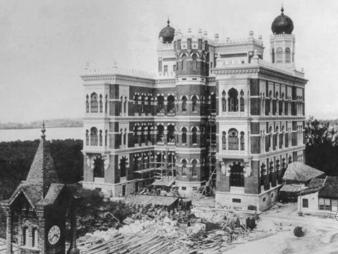
■ Pabellón morisco en construcción, diseñado por el arquitecto Luiz de Moraes Júnior, s.d.